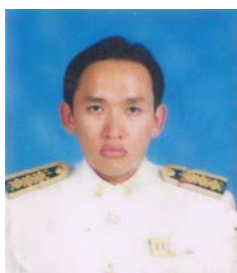
คณะกรรมการ