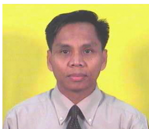
คณะกรรมการ