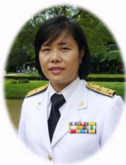
คณะกรรมการ