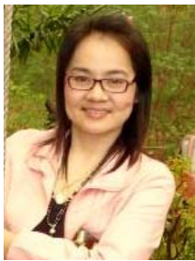
คณะกรรมการ วิทยาลัยพิษณุโลก