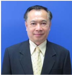
คณะกรรมการ วิทยาลัยพิษณุโลก