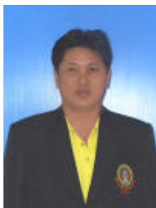
คณะกรรมการ